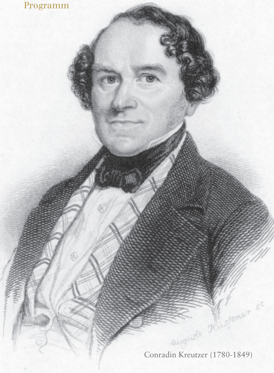
Conradin Kreutzer (1780-1849)